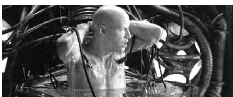
Neo, ontwaakt, bevrijdt zich uit zijn capsule

Mensen in capsules doen dienst als energiebron voor de machines en staan in verbinding met een computersysteem dat hen in de waan houdt dat zij in een normale wereld leven