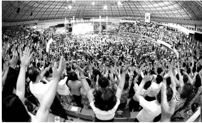
Shinjeonchi Church bijeenkomst in Zuid-Korea

Met bovenstaande analyse van het onderscheid tussen religie en pseudoreligie heb ik, naar ik aanneem, genoegzaam aangetoond dat dit onderscheid reëel gemaakt kan worden. Het ligt voor de hand dat het vóórkomen en de groei van dergelijke ongebonden of pseudoreligies een gevolg zijn van de opkomst van de secularisatie die zich vanaf de Verlichting in het Westen heeft ontwikkeld. Immers, de relativisering van de