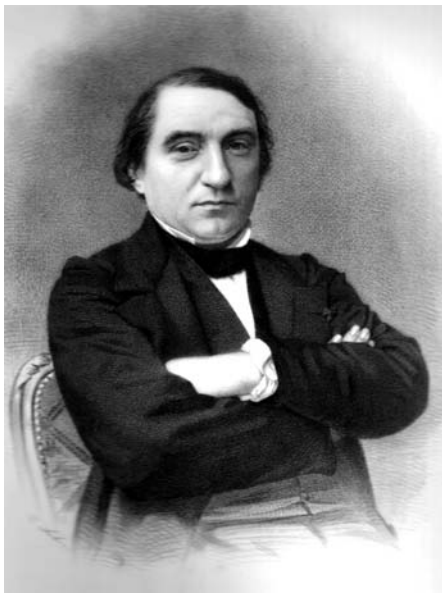
Pétain, Laval en andere aanhangers van het gesloten natiebeprijp.