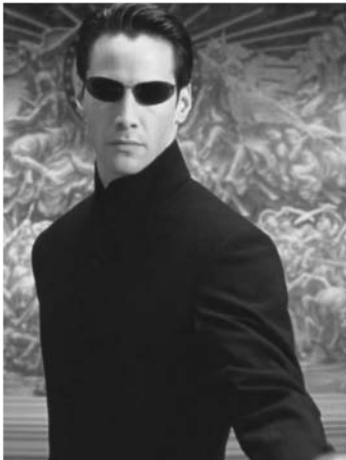
Keanu Reeves speelt de hacker Thomas ('Neo') Anderson