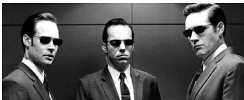
Agents van de Matrix