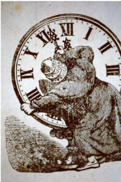
Paus zet de klok terug; titelvignet

In de tweede druk veranderde hij niets aan de feiten, de stijl en de toon en 'daar een anatoom, die ten beste der mensheid in rottende lichamen woelt, geen handschoenen kan dragen, zoo kan ook ik het rottende papenlichaam niet met glacé-handschoenen aanvatten.' Daarmee is niets te veel gezegd. Alles is mis aan de roomse religie: de maagdelijke geboorte van Jezus (soms via het oor ontvangen?), de heremieten die de woestijn introkken en zichzelf kwelden. Simeon de Pilaarheilige en de Inquisitie. Franciscus van Assisi was wel in orde, maar zijn opvolger Elias was 'een sluwe, doortrapte snaak'. Ach, kijk maar naar de prentjes die het boek verluchten.