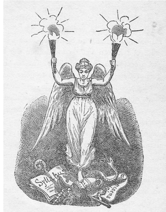
De Verlichting vertrappt pauselijke encyclieken