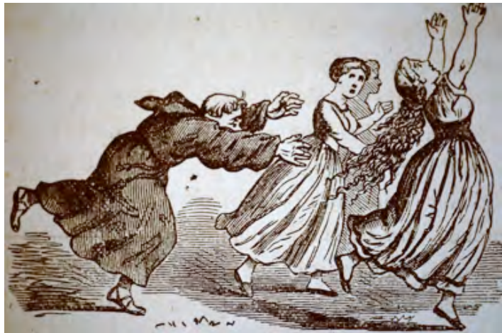
Celibataire monnik zit achter de meisjes aan