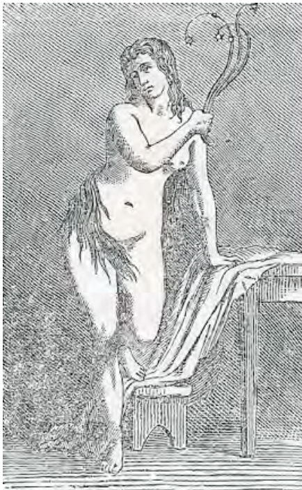
Heilige Magdalena kastijdt zich

Waar leg je de grens? Waarom mogen mensen dieren geen klein leed bezorgen terwijl het dierenleed in de amorele natuur veel groter is? Veganisten houden schone handen, maar het is de vraag of het dierenleed in de wereld er minder door wordt. Als goedbedoelde principes dogma's worden, ontstaat religie. En het spijt me dat ik het zeggen moet, maar veganisme begint erg op religie te lijken.