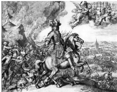
Willem III bij de slag aan de Boyne

katholieke burgers van Noord-Ierland zich steeds meer achtergesteld voelden ten opzichte van het protestante deel van de bevolking en gelijke rechten opeisten. De protestanten voelden zich hierdoor bedreigd en reageerden met veel machtsvertoon. De regering in London vond, dat de protestante Noord-Ierse regering de problemen verkeerd aanpakte en koos voor afschaffing van het zelfbestuur en stuurde troepen om de orde te herstellen. De Engelse soldaten werden door het gematigde