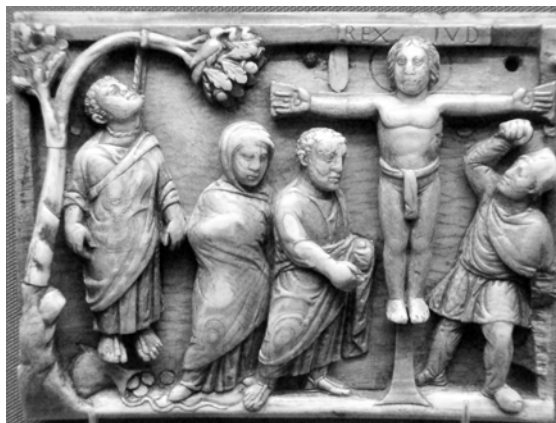
de verrader Judas samen met de verlosser Jezus

zzAls bisschop van Hippo in Noord-Afrika zag Augustinus zich geconfronteerd met een concurrerende christelijke kerk, die van de Donatisten. Zij vereerden als martelaren zelfs degenen die zich in religieuze vervoering van hoogten hadden gestort. Om aan te tonen dat dit gedrag allesbehalve christelijk was en dat de Donatisten dus ketters waren, zocht Augustinus naar argumenten in de gemeenschappelijke autoriteit van de Bijbel. Hij legde het gebod 'gij zult niet doden' uit als een algemeen verbod op doden van mensen door mensen (behalve natuurlijk in geval van een rechtvaardige oorlog...) 'Hij die zichzelf doodt, is een moordenaar ( Qui se ipsum occidit homicida est ),' verklaart Augustinus in Staat Gods . Zonder het woord te gebruiken – om de eenvoudige reden dat het nog niet bestond – heeft Augustinus al het concept dat een eigendoder een suicida is. In zijn drang om aan te tonen dat de Donatisten volstrekt anti-Bijbels bezig zijn, graast hij de Heilige Schrift af.